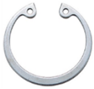
スナップリングC型(穴用)

別名は「止め輪」とも呼ばれていて、簡単に言うと部品と部品を固定させるための物です。阪神ネジでよく出荷させて頂くのはC型の「軸用」と「穴用」、E型です。C型やE型はアルファベットのC、Eに似ているからこの呼び名だとか。。。って、そのまんまやないかーい！