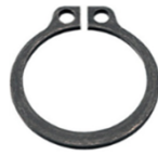
スナップリングC型(軸用)

穴の中にはめて使います。サイズを測る時は、外径を測ります。穴にはめて使用する為、表記のサイズより少し大きくなっています。