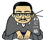
社長(年男です。うさぎっぽくないですが…)